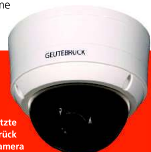
eingesetzte Geutebrück Domekamera