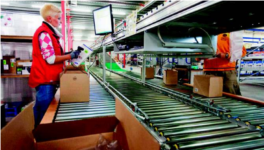
redcoon-Zentrallager mit Supply Chain Security Lösung